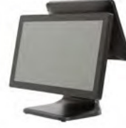
DOKUNMATİK POS PC