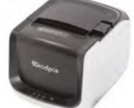
FİŞ/ ADİSYON YAZICILARI